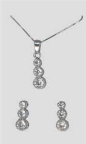
6118STR gr. 5,10