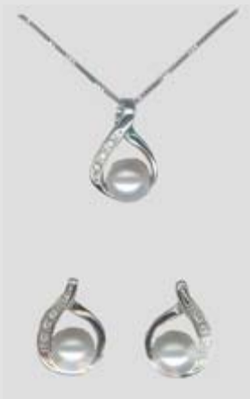
2594STR gr. 5,30