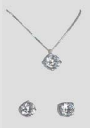
6297STR gr. 4,50