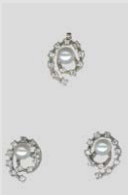
2607STR gr. 4,60