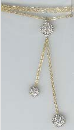
2602COP gr. 3,00