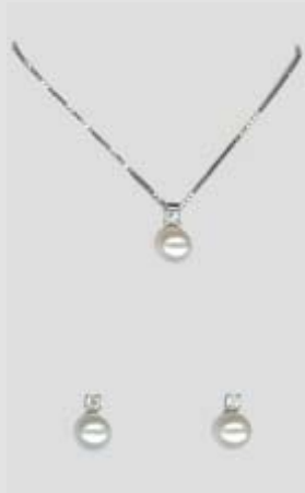
2588STR gr. 2,60