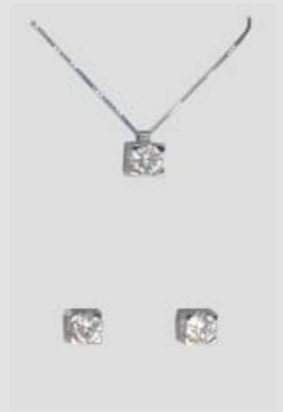
6305STR gr. 4,30