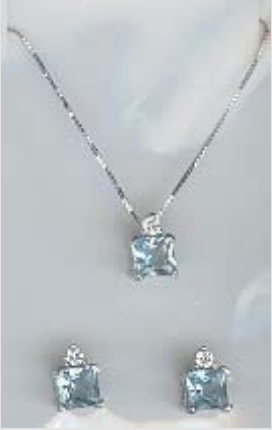
6294STR gr. 4,10