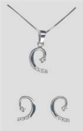
5827STR gr. 4,20