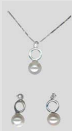
2600STR gr. 4,00