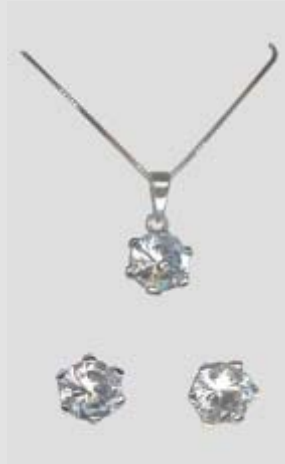
6301STR gr. 6,20