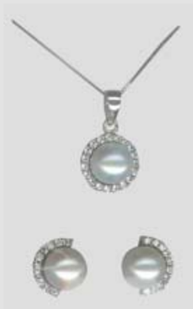
2612STR gr. 6,30 PEND. 3469