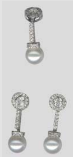
2678STR gr. 8,20