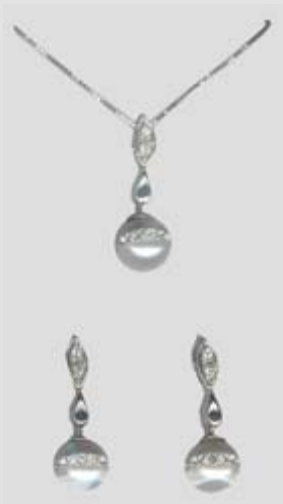
2593STR gr. 4,20