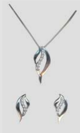
5824STR gr. 3,50