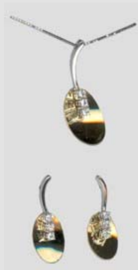
5840STR gr. 5,10