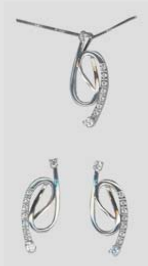
6354STR gr. 8,40