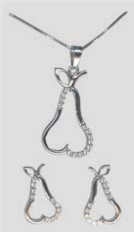
5828STR gr. 4,70