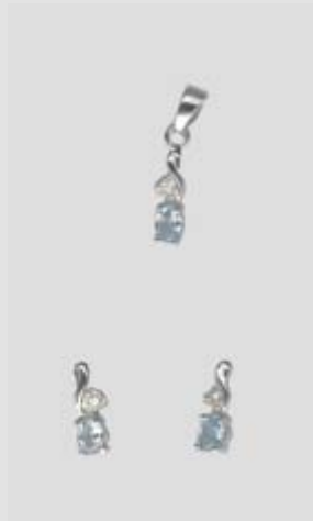
6313STR gr. 3,30