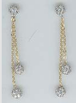
2602ORP gr. 2,20