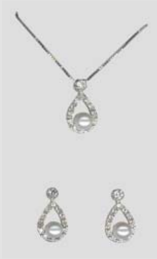
2587STR gr. 4,30