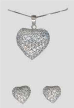
6080STRN gr. 7,40