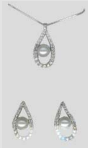
2589STR gr. 5,30