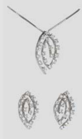
5934STR gr. 5,20