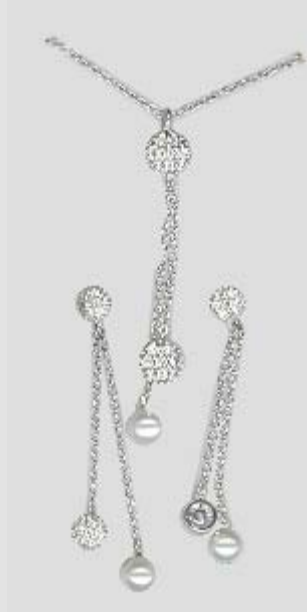
2602STR gr. 5,30