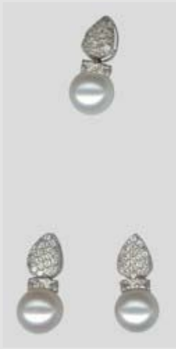
2677STR gr. 6,80