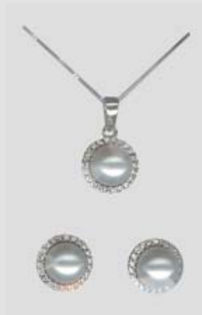
2613STR gr. 6,50 PERLA 7,5/8