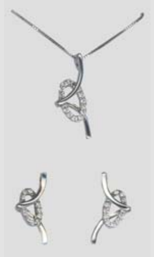
5825STR gr. 5,40