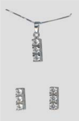
6309STR gr. 5,40