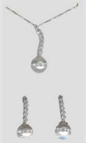
2592STR gr. 4,30