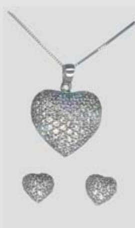
6090STRN gr. 6,90