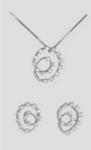
5932STR gr. 4,60